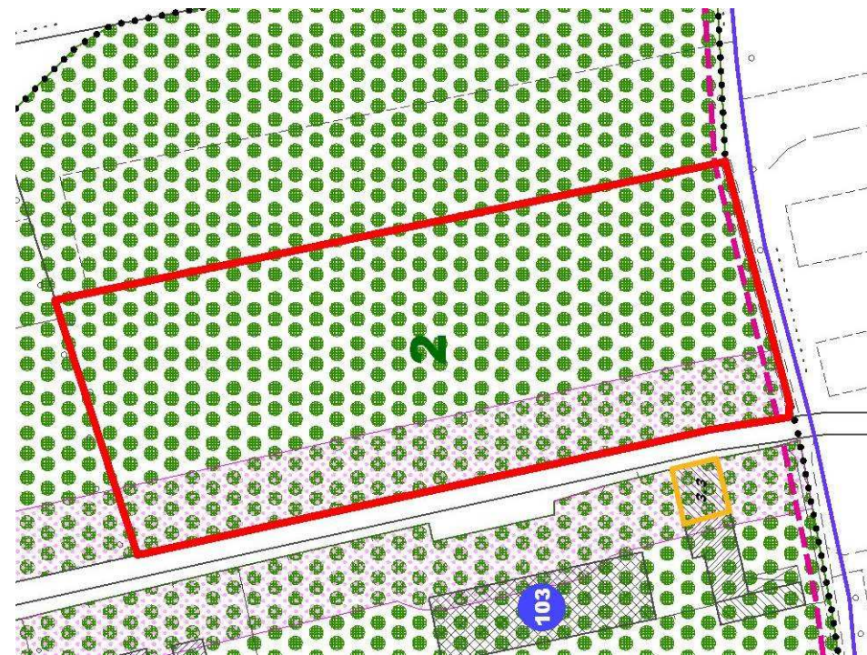
Estratto Piano interventi scala 1:2.000.

TITOLI AUTORIZZATIVI ESISTENTI: 53/2004.