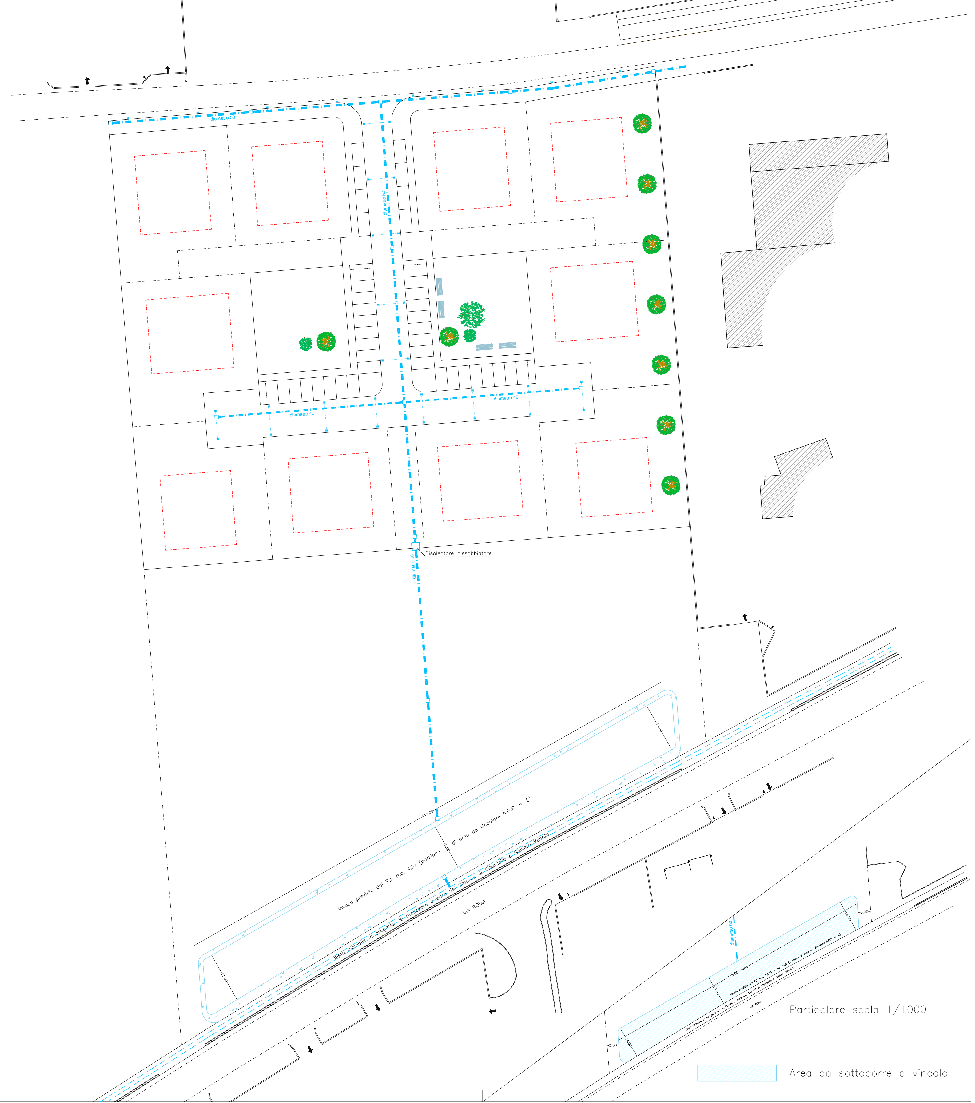
Particolare scala 1/1000