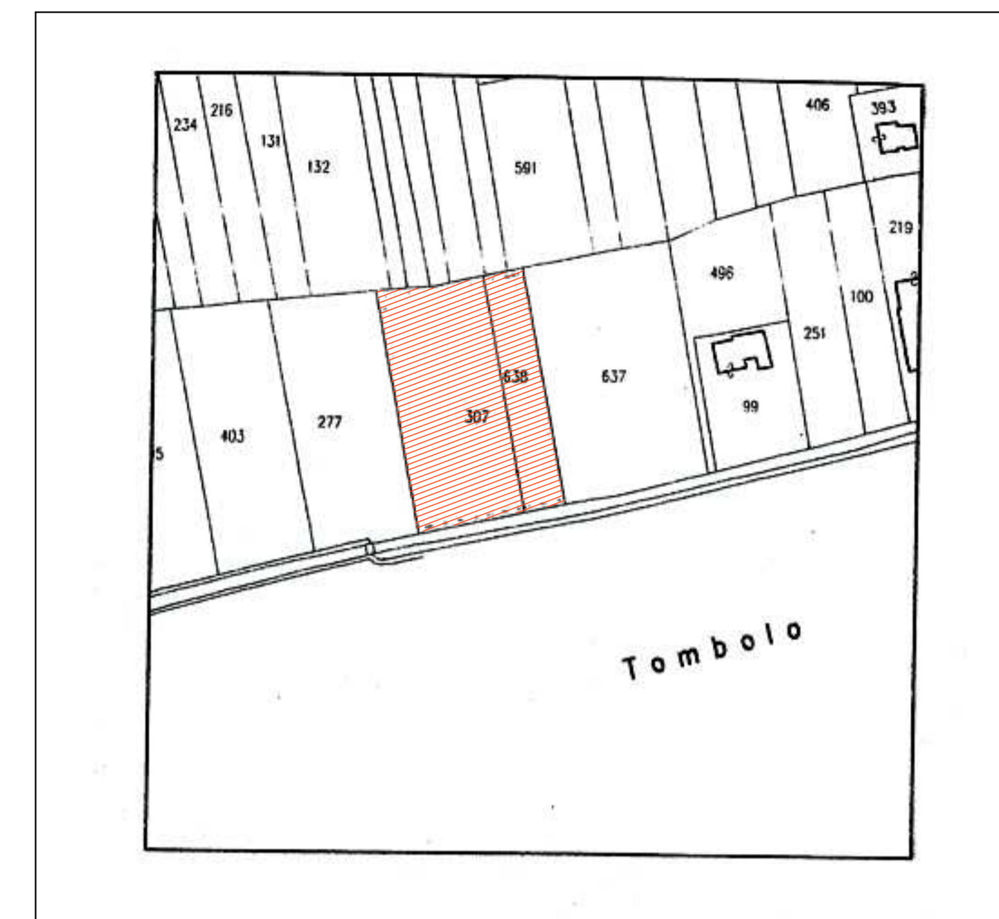
ESTRATTO DI MAPPA scala 1:2000 Comune di Galliera Veneta (Padova) Foglio 8 - Mappali 307 - 638